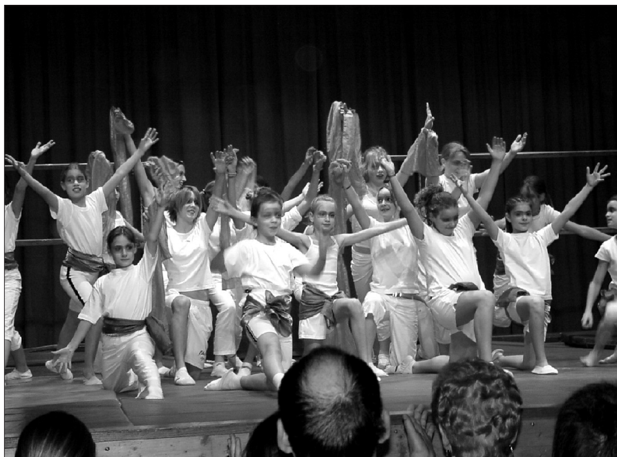
La plupart des acteurs de cette soirée n'étaient pas nés la dernière fois que l'Alliance s'est produite sur la scène de l'Aiglon.

Les 20, 26 et 27 novembre derniers, l'Alliance retournait, après dix-huit années, présenter son spectacle annuel à la salle de l'Aiglon.