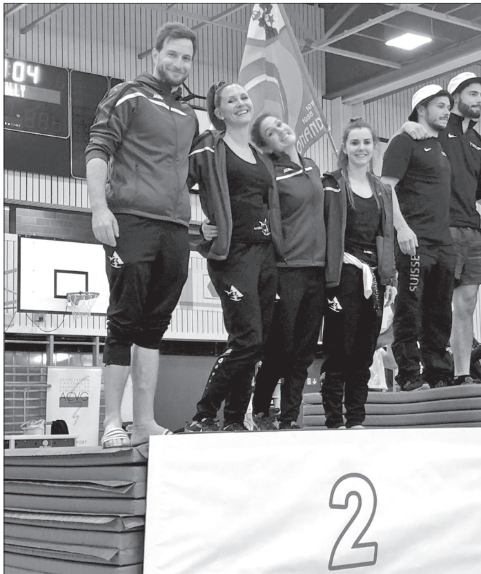
Les coaches sur le podium des Championnats vaudois à Pully.