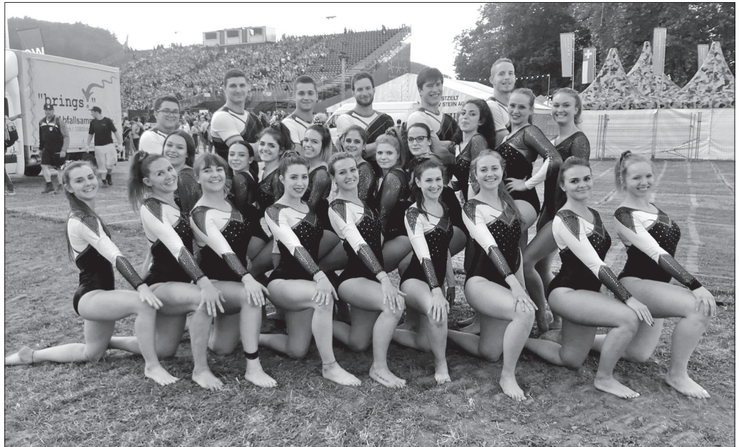
... et en tenue de compétition.

Puis nous avons continué par l'exercice du sol où nous avons dû interrompre la production après une minute car les juges n'étaient pas en place... Quel stress!