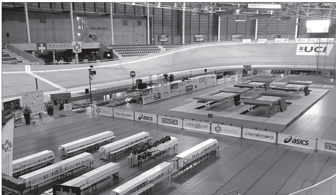
Le site du CMC, idéal pour les compétitions de trampoline.