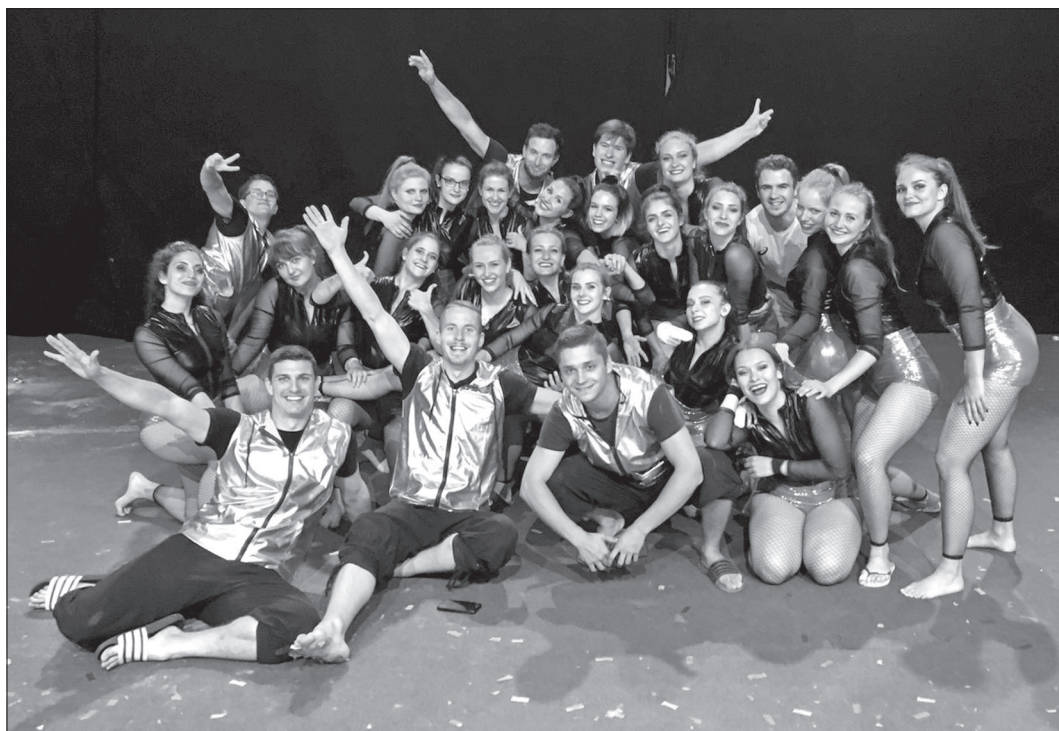
Le groupement des Actifs-Actives en tenue de gala...

5. Aigle-Alliance Agrès-Mixtes: Combinaison d'engins 9.46; Sol 9.56; Sauts 9.45; Total 28.47.