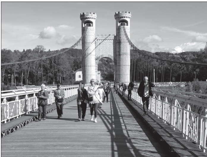
Pont Charles-Albert, ancien pont suspendu inauguré en 1839, plus connu sous le nom de Pont de la Caille.