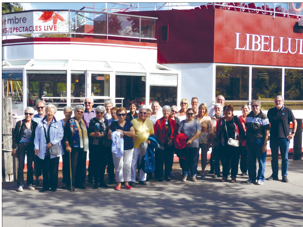
Le 28 septembre dernier, le groupement des Honoraires était de sortie. Vingt-six membres et conjoints se sont retrouvés pour une journée lacustre dans le chef-lieu de la Haute-Savoie, Annecy.