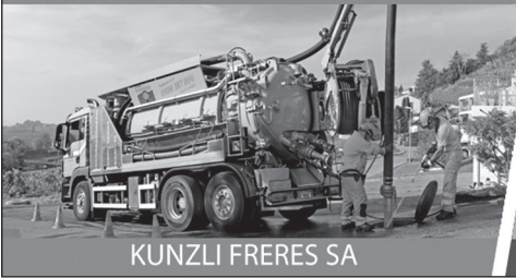
KUNZLI FRERES SA