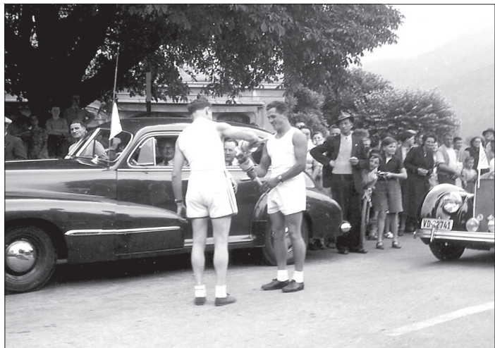
24 juillet 1948 – Deux de nos gymnastes sont désignés pour la transmission de la flamme olympique à Aigle pour les Jeux de Londres.