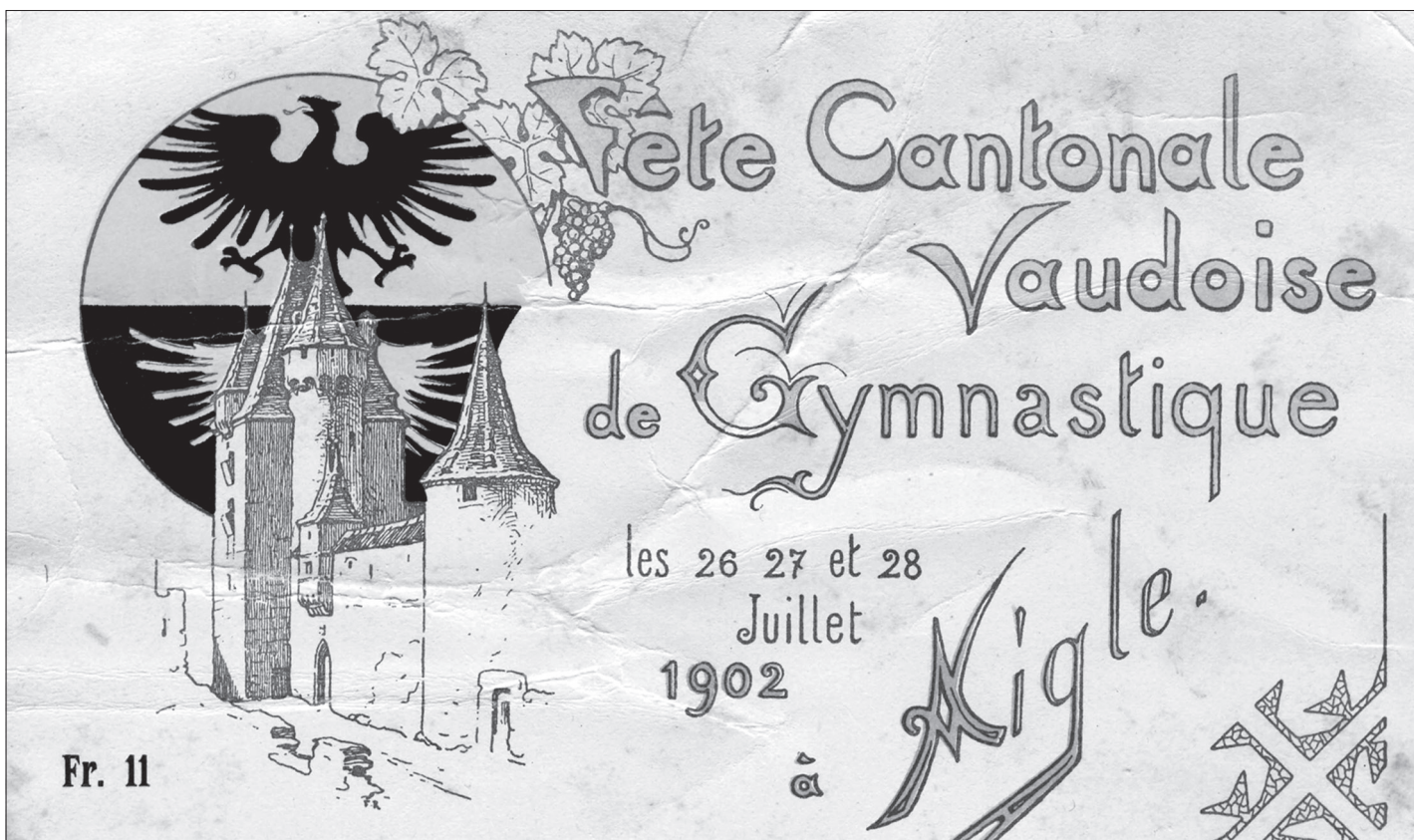
Les fêtes cantonales vaudoises de gymnastique désormais inscrites au patrimoine immatériel vaudois (voir pages 8 et 9).