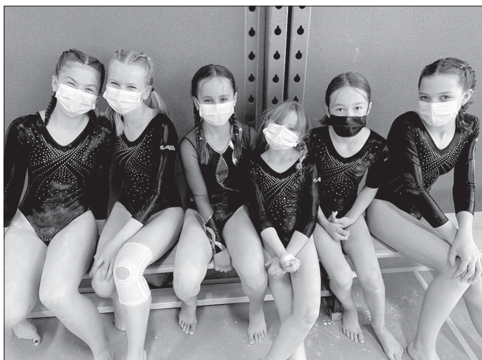
Gymnastes C1 à C3.