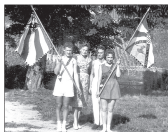
1961 - Inauguration des nouveaux drapeaux des pupilles et des pupillettes.

L'année 1961 démarre en grande pompe puisqu'elle marque les 50 ans de l'Alliance. Pour l'occasion, les groupements des pupilles et des pupillettes inaugurent leurs nouveaux drapeaux et les actifs se rendent à la Fête cantonale tessinoise où ils réalisent un très bon score.