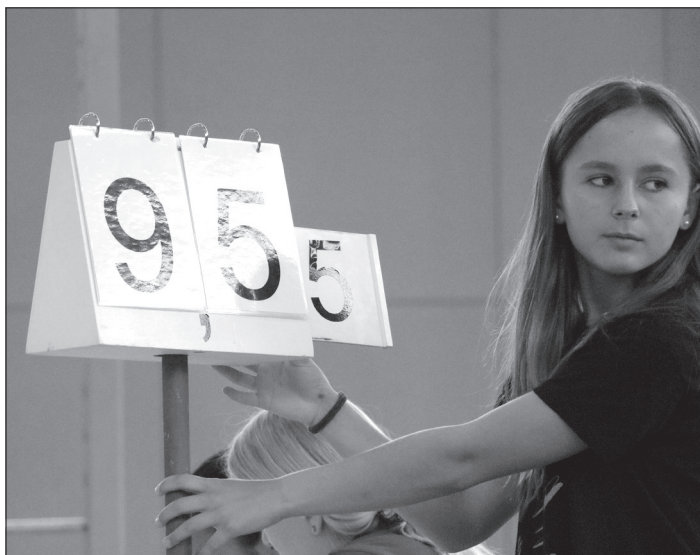
Tourner les notes.