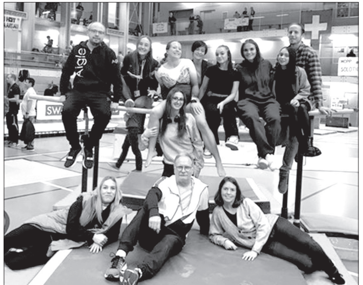
Gymnastes et supporters aux Championnats suisses féminins individuels à Kirchberg.