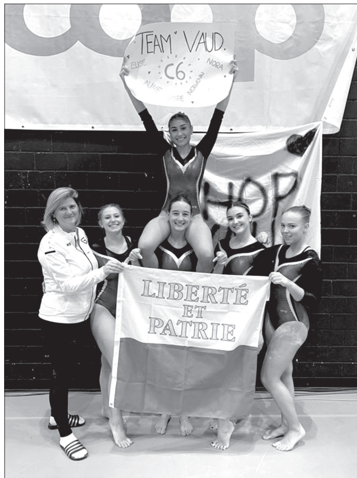
Coach et gymnastes de l'équipe vaudoise C6 aux Championnats suisses par équipe à Olten.

Le week-end des 29 et 30 octobre a été chargé pour la société de Morges qui a accueilli les Championnats suisses masculins de gymnastique aux agrès. Plusieurs résultats ont pu faire grandement sourire l'équipe Vaud comme une quatrième place de la part de l'yverdonnois