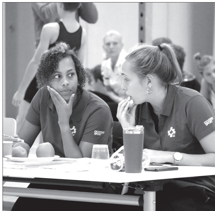
Des juges très concentrées.

Ouais, ouais. J'ai fait le concours, j'ai coaché, j'ai bossé!