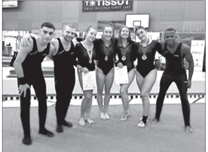
Les C6 et C7 aiglon·ne·s aux Championnats romands à Neuchâtel.