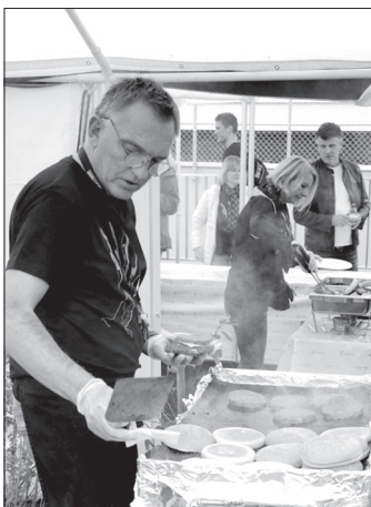
La préparation des hamburgers.