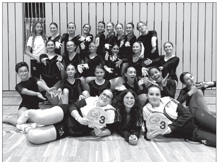
Le groupe Agrès-mixtes.