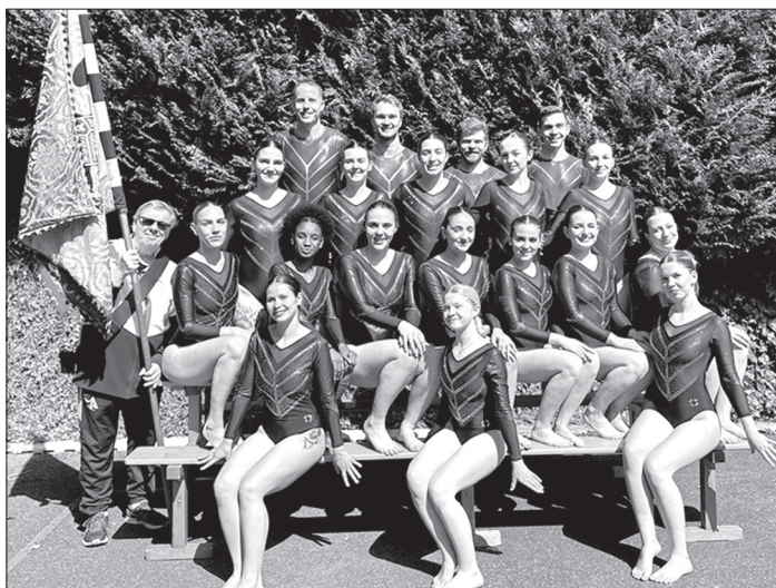
Le groupe Actifs-Actives.