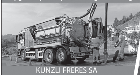
KUNZLI FRERES SA