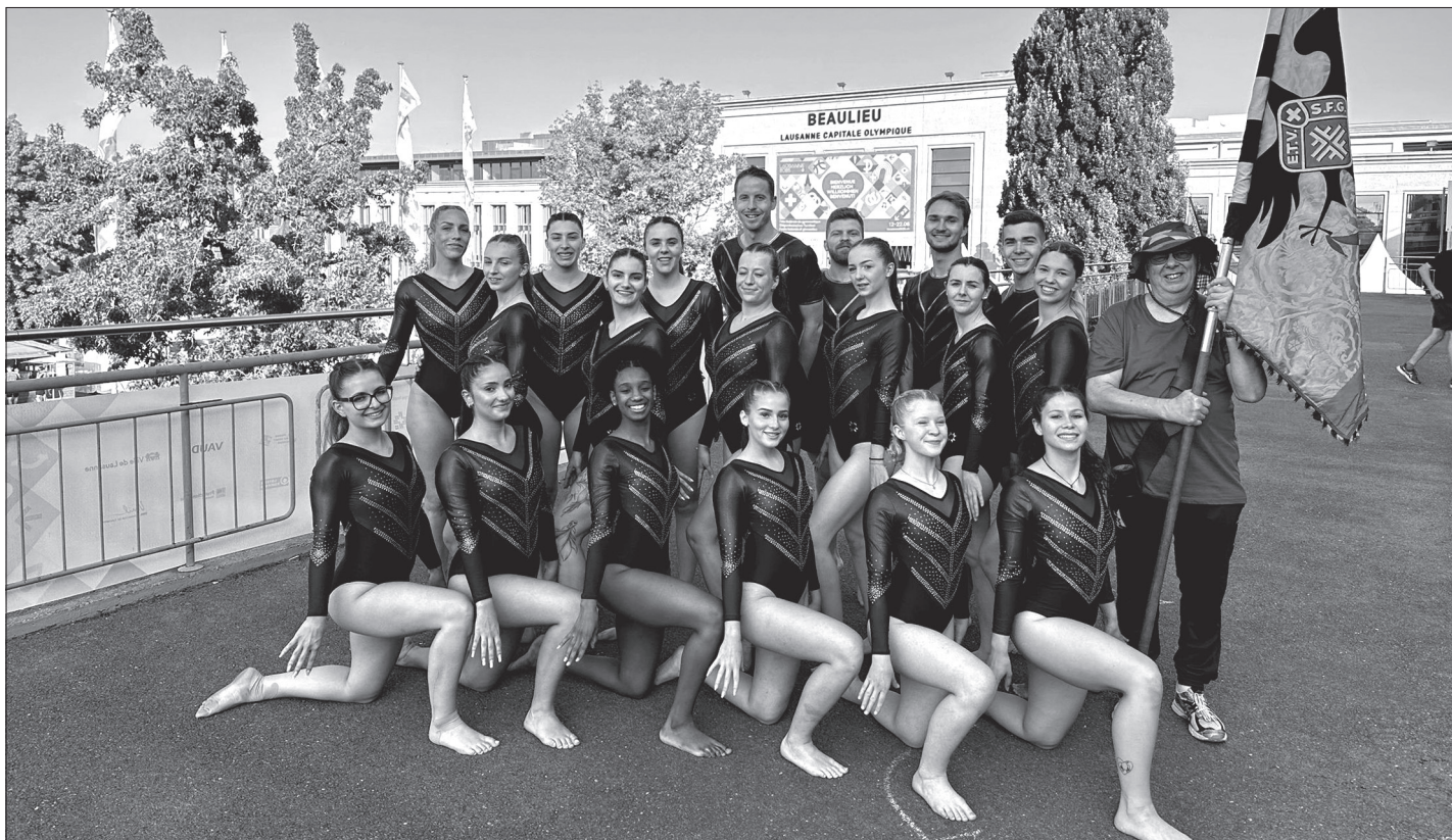
Le groupe Actifs-Actives.